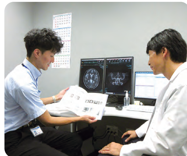
現場での仕事風景：ひろせ脳神経外科・頭痛クリニック様