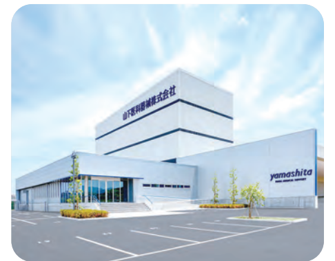
長崎物流センター（諫早市）